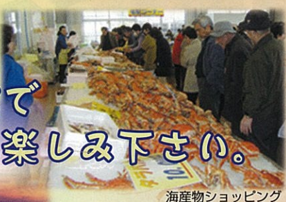
海産物ショッピング